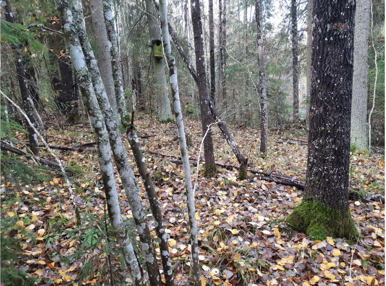
Luonnontilaisen kaltaista rantametsää leimikkokuviolla 1