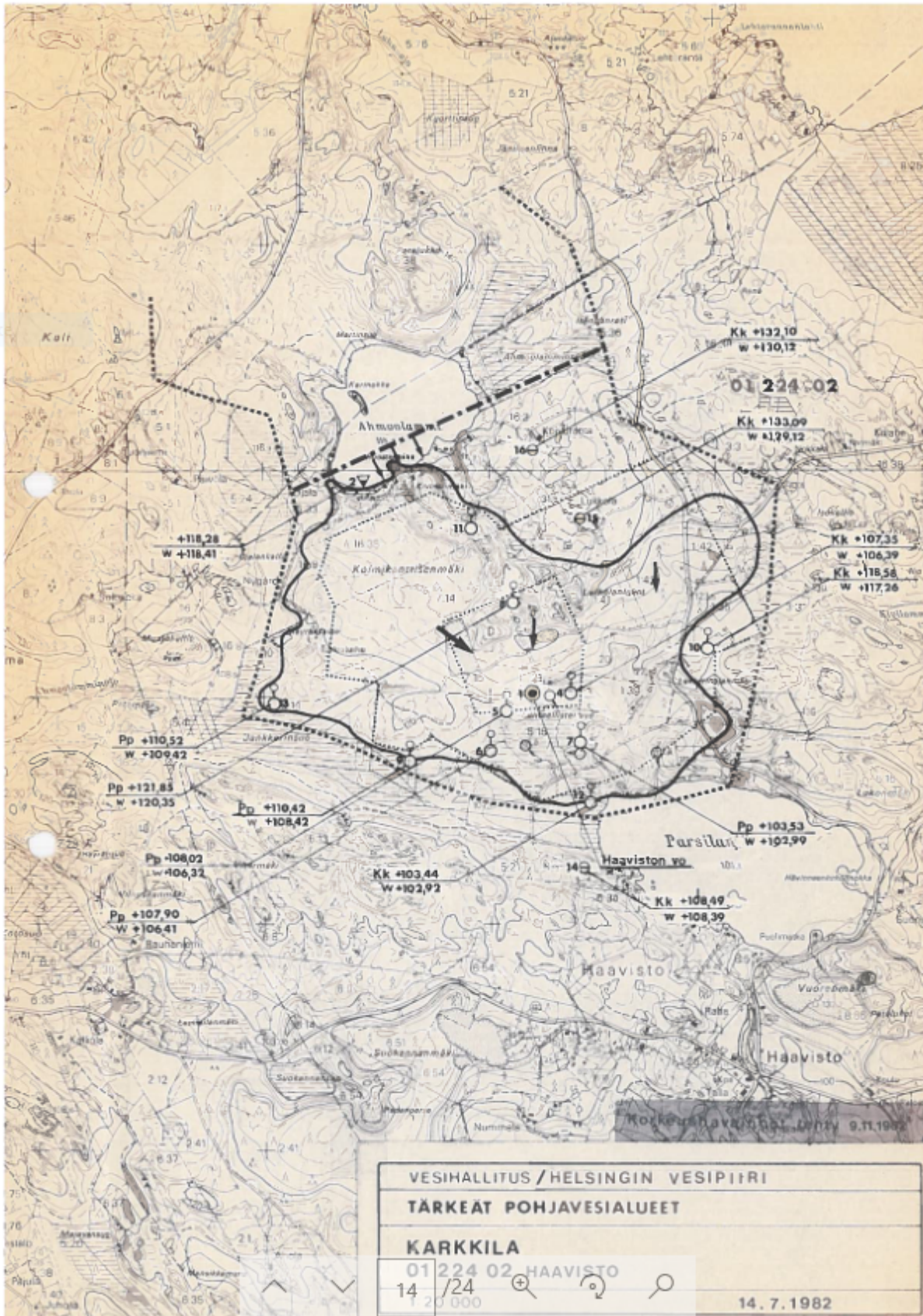
Liite 1. Haaviston pohjavesialuekartat vuosilta 1982, 1994 ja 2017. Pohjavesialuerajaus on sama.