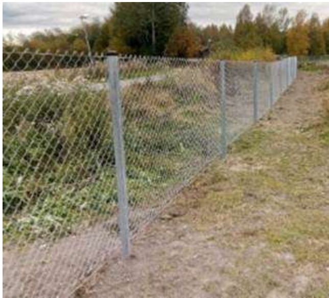
Kuva 1. Tyyppikuva alueelle rakennettavasta teräsverkkoaidasta.

Nykyisen aidan sisäpuolella louhitaan vielä 1-2 kertaa ennen aidan purkamista. Louhinta edeltävän maa-ainesluvan mukaisen aidan sisäpuolella ei vaaranna turvallisuutta.