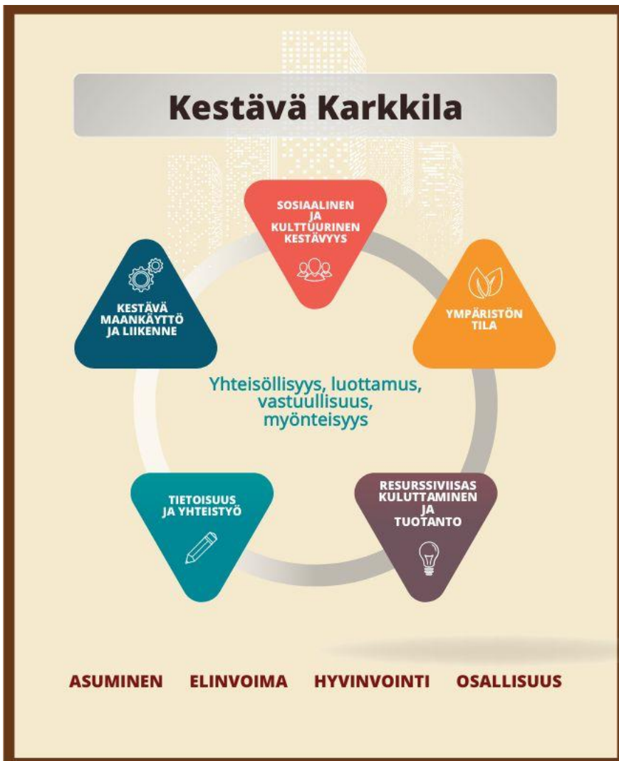
Kuva 4. Karkkilan strategiset painopisteet, arvot sekä kestävän kehityksen teemat

Alla on esitetty Kestävä Karkkila –ohjelman strategiset painopisteet sekä kaupungin määrittämät arvot ja kehitettävät näkökulmat. Kestävä Karkkila –ohjelman painopisteet tulee sovittaa mahdollisimman tarkasti ja tiukasti kaupungin strategiaan.