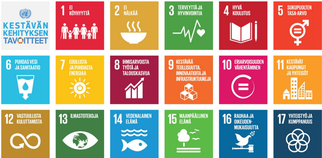
Kuva 1. YK:n Agenda 2030 –tavoitteet (SDG)

YK:n Kestävän kehityksen neuvoston mukaan Suomi on jo saavuttanut tai on saavuttamassa ne Agenda 2030:n päätavoitteet, jotka liittyvät köyhyyden poistamiseen, terveyteen ja hyvinvointiin, laadukkaaseen koulutukseen, puhtaaseen veteen, energian saatavuuteen ja puhtauteen, säälliseen työhön ja talouskasvuun, teollisuuteen ja innovaatioihin, eriarvoisuuden vähentämiseen, kaupunkien ja paikallisyhteisöjen kestävyteen, sekä instituutioiden ja oikeusjärjestelmän toimivuuteen. Suomen suurimmat ekologiset haasteet liittyvät kulutus- ja tuotantotapojen muutostarpeeseen, ilmastotoimiin, merien ja vesistöjen tilaan sekä muiden maiden tukemiseen Agenda 2030:n toimeenpanossa.