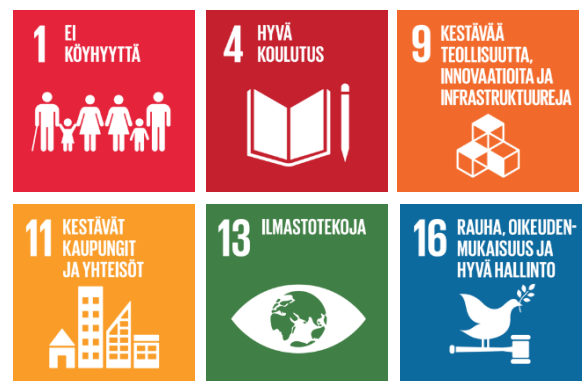
Kuva 2. Resurs-siviisaan Uudenmaan tavoitteet

Uudenmaan älykkään erikoistumisen strategiassa, Resurs-siviisas Uusimaa –ohjelmassa, Uudenmaan tavoitteeksi on valikoitunut kuusi kärkiteemaa globaaleista tavoitteista (Kuva 3). Strategian läpileikkaavana tavoitteena on osaamisen kehittäminen. Strategia on laadittu huomioiden, että globaalit megatrendit vaikuttavat myös Uudenmaan toimintaan. Megatrendit ovat väestönmuutos, ilmastonmuutos, globalisaatio sekä digitalisaatio. Kaikki edellä mainitut vaikuttavat myös Karkkilan kestäväan kehitykseen.