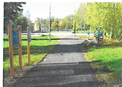
Reitin selkeys rohkaisee liikkumaan.