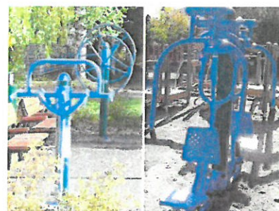
Kuntoilupisteissä voi nauttia vuodenaikojen mukaan ilmestään muuttavista kasvillisuusalueista.

Sivustomme käyttää evästeitä käyttökokemuksen parantamiseksi. Käyttämällä sivustoa hyväksyt evästeiden käytön. Lue lisää