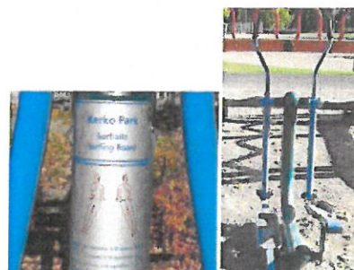
Selkeä ohjeistus mahdollistaa omaehtoisen kuntoilun.